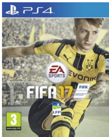
La couverture du jeu