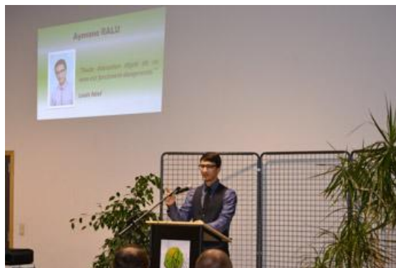
Un candidat dans le feu de l'action