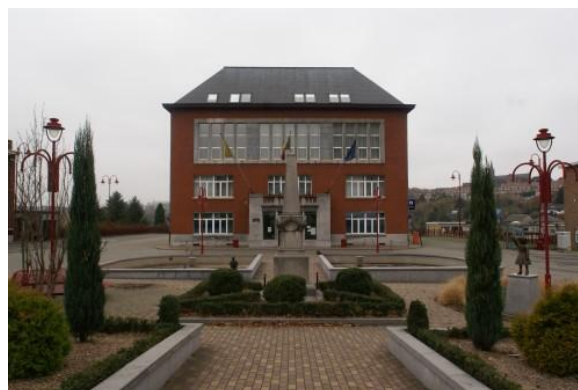
L'Administration de Saint-Nicolas

Bien entendu, tous les citoyens ne sont pas respectueux de leur environnement. La commune a donc pris des mesures de prévention dans un premier temps, afin d'informer la population des endroits