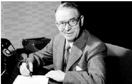
Ole Kirk Christiansen

Ole Kirk Christiansen fonde l'entreprise Lego, à Billund au Danemark.