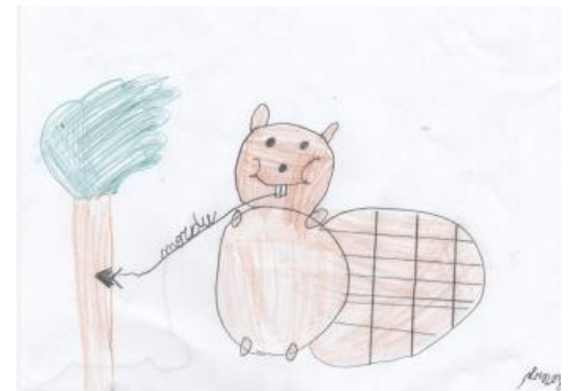
Réalisé par Lorenzo