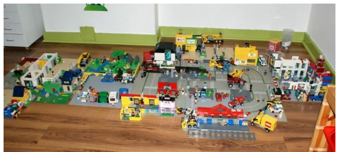
Ville Lego construite par Cyril

Depuis 1949, 327 milliards d'éléments ont été fabriqués. Plus de 400 millions d'enfants et adultes jouent par an avec des légos. Le jouet est disponible dans 130 pays. 7 boîtes de légos sont vendues chaque seconde à travers le monde.