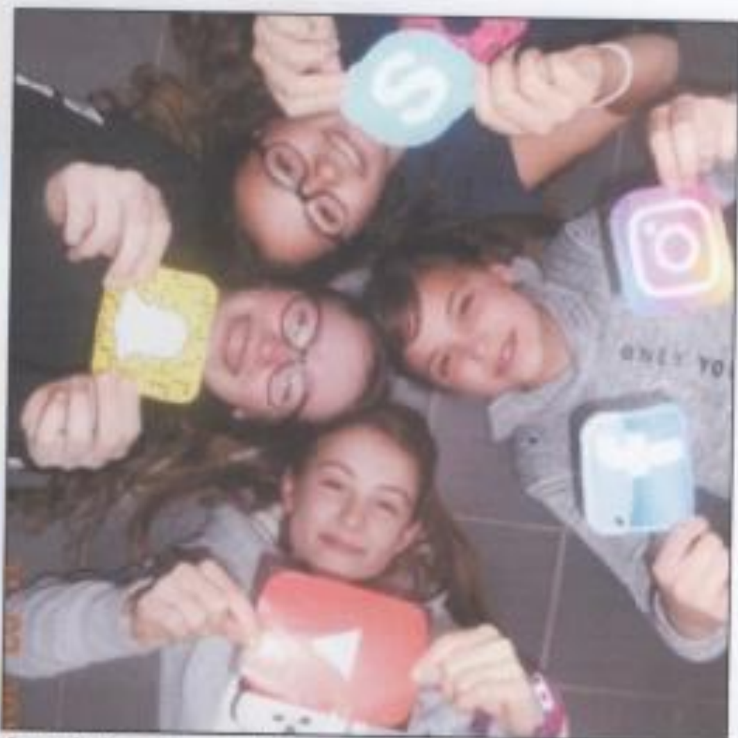
La mode des réseaux sociaux