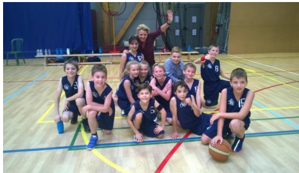
Equipe du Bc Silly lors de leur première victoire

gagner nos matchs. Le club existe depuis deux ans et exerce ses activités à la salle Sillysport qui se situe à Bassilly dans la rue Tabord n°70.