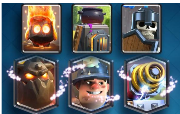
Quelques modes de rareté

Le but de ce jeu est de détruire les tours ennemies, avant que les tiennes ne tombent en ruines, avec des troupes (modes de rareté) que tu collectionneras à partir d'un camp d'entraînement jusqu'à l'arène 10.