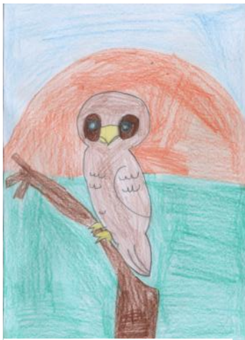
Réalisé par Sarah, 2B