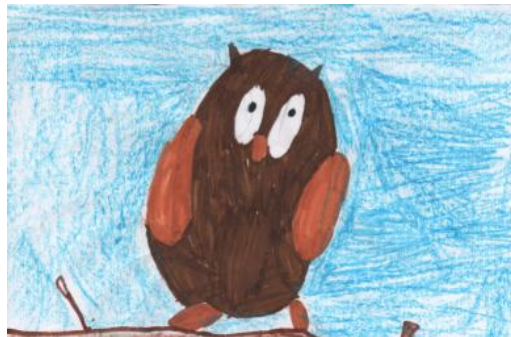
Réalisé par Anaïs