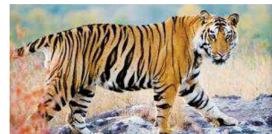
Le tigre du Bengale

Quand on parle du Bangladesh, on pense souvent au tigre, c'est l'animal national et symbolique. Le rugissement de cette créature majestueuse peut s'entendre jusqu'à 3 kilomètres de distance ! Malheureusement, il fait aujourd'hui partie des espèces en voie de disparition.