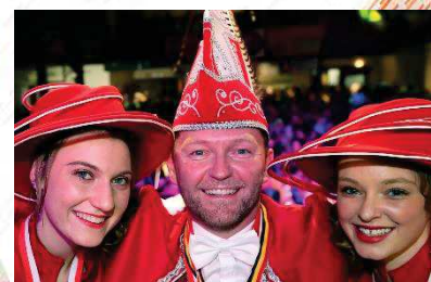
Le grand prince Olivier Ier et ses pages.

Tout le comité vous donne rendez-vous le 6 mai à 22h pour le cortège nocturne.