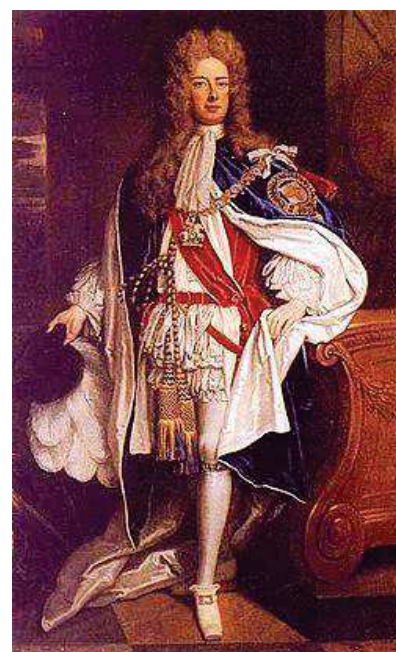
John Churchill, premier Duc de Marlborough

Comme il a contribué à l'histoire de notre commune et est de nationalité anglaise, c'est donc tout naturellement que notre école porte son nom.